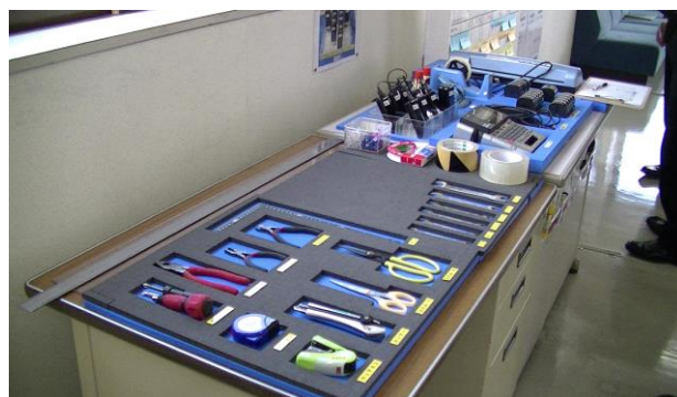
仕事の効率を上げる 整頓の仕組み