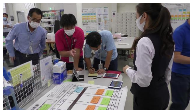
ボトムアップで業務改善ができる 仕組み