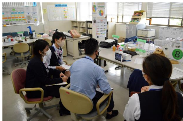
オンラインでコーチング研修など IT化もすごい!